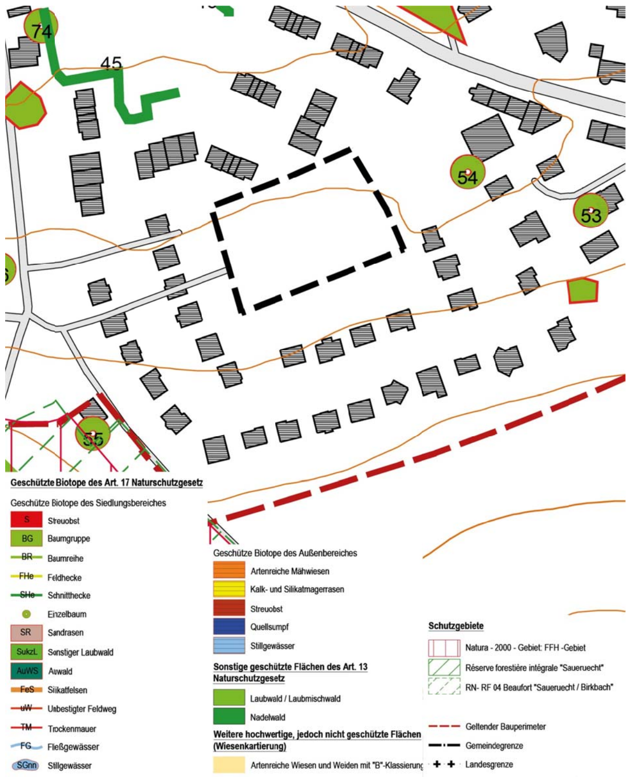
Abbildung 4 Auszug Biotopkataster