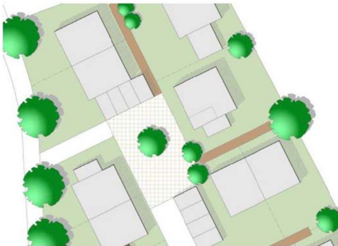
Abbildung 3 Beispiel für die Platzgestaltung innerhalb des neuen Quartiers

Das Schéma Directeur wird über eine mischgenutzte Stichstraße mit Wohnhof erschlossen, die von den Anwohnern als Begegnungsraum genutzt werden kann. Zudem ist im Südwesten der Fläche Retentionsfläche vorgesehen, die über einen Fußweg für die Öffentlichkeit zugänglich gemacht werden soll.