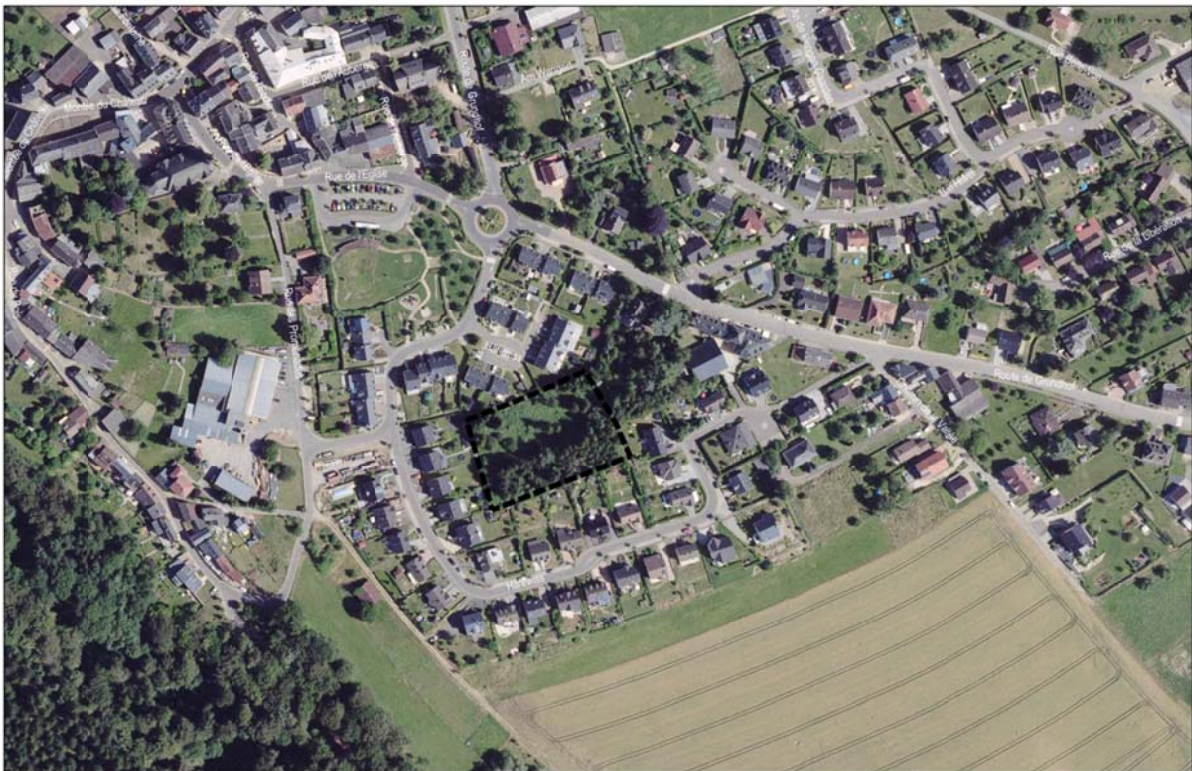
Abbildung 2 Verortung des Plangebietes (Luftbild)