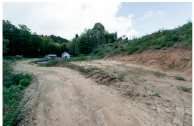
Der Baubeginn der Kläranlage ist für November geplant.

Diesbezügliche Vorbereitungsarbeiten, neuer Zufahrtsweg, Geländetausch, die Planung zur Vergrößerung sowie die komplette Erneuerung der Kläranlage sind soweit abgeschlossen und die ausgeschriebenen Arbeiten werden in diesem November beginnen.