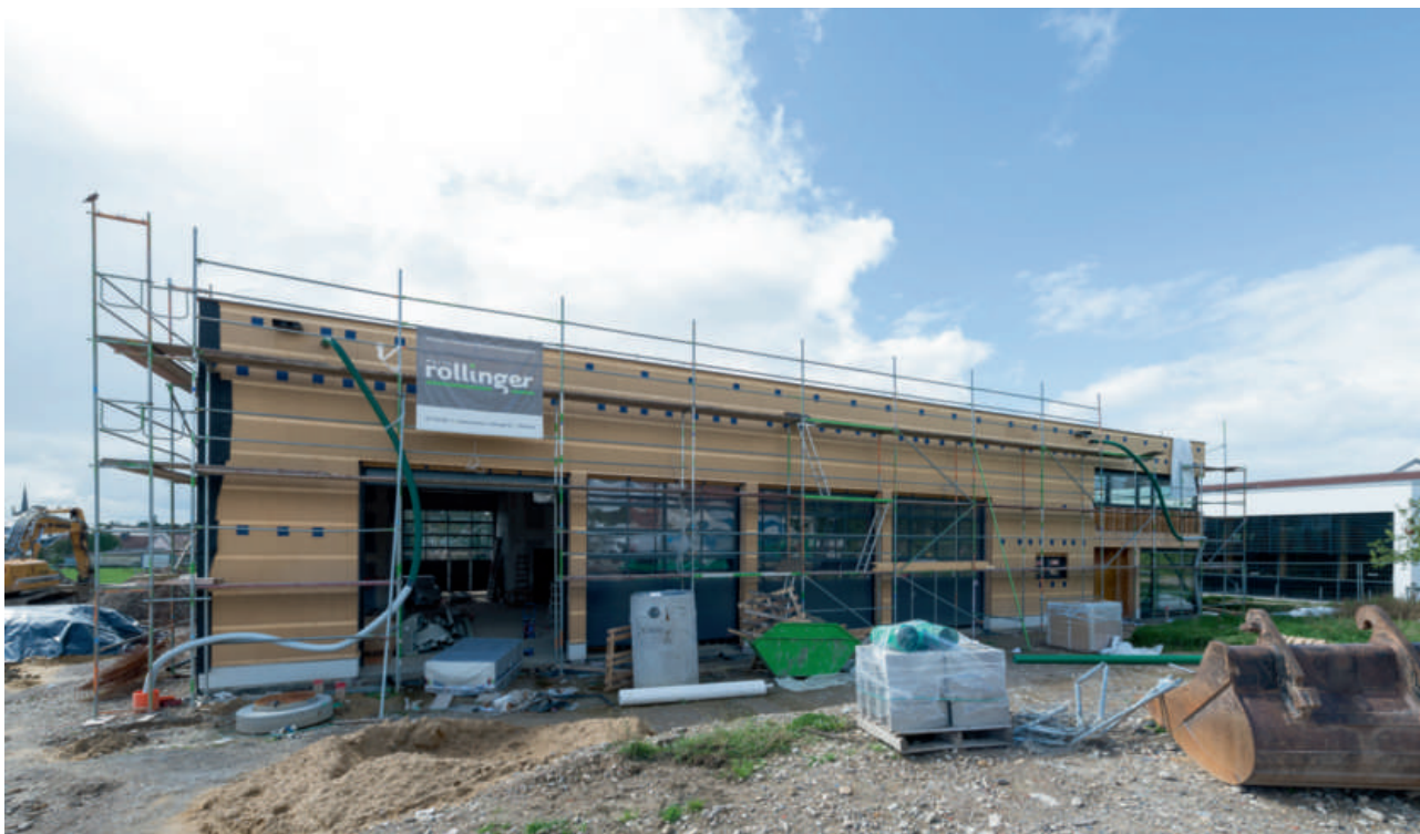
Die Arbeiten am neuen Feuerwehrbau stehen kurz vor dem Abschluss.

Gleiches gilt für den neuen Wasserbehälter „op der Heed“, wo auch sämtliche benötigten Genehmigungen vorliegen. Die Arbeiten werden jetzt im September ausgeschrieben und Baubeginn ist dann im nächsten Frühjahr.