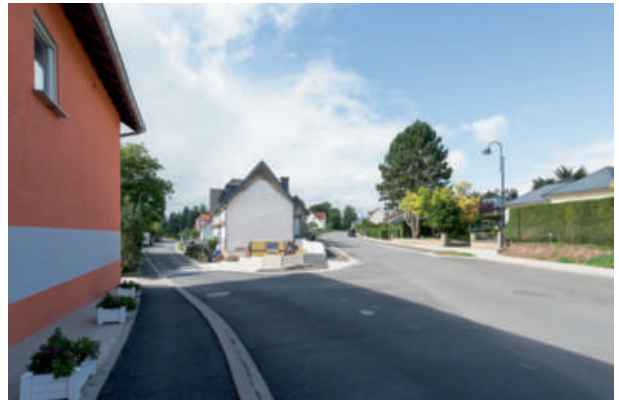
Investitionen in die Erneuerung des Trinkwasser- und Kanalisationsnetzes sowie des Straßenbaus: route d'Eppeldorf in Befort (oben) und rue de la Sûre in Dillingen (unten).

Erhebliche Summen wurden in die Erneuerung des Trinkwasser- und Kanalisationsnetzes sowie den Straßenbau investiert. In Befort stehen die aufwendigen Arbeiten in der Route d'Eppeldorf vor dem Abschluss. In Grundhof wurde der CR121 bis Vogelsmühle erneuert und ein gesicherter Fussweg zur Hallerbachpromenade wurde angelegt. In Dillingen ist derzeit die komplette Instandsetzung der Rue de la Sûre in Angriff genommen.