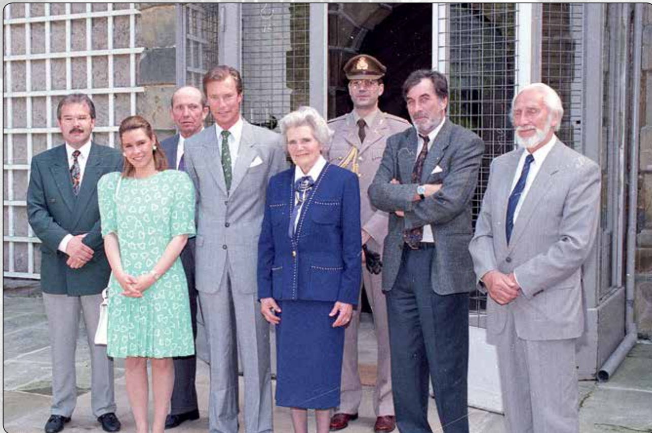
17. Mai 1993: Erbgroßherzog Henri und Erbgroßherzogin Maria-Theresa zu Besuch im Beforter Schloss.