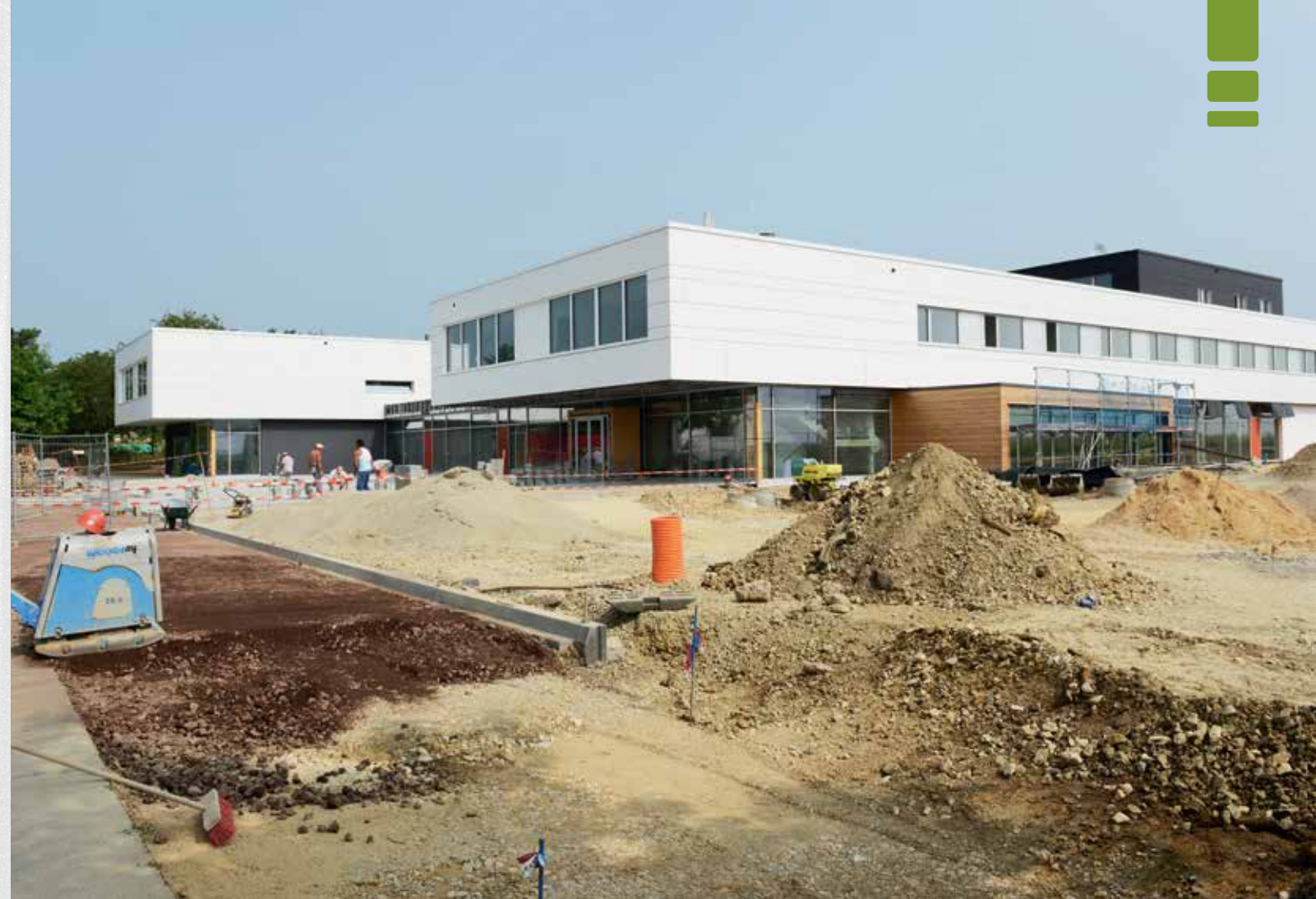
Die Maison Relais und die Jugendherberge im Juli 2013

Impression: Imprimerie Mil Schlimé Luxembourg • Imprimé sur papier recyclé