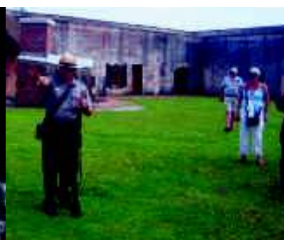
Führung durch „Fort Macon“