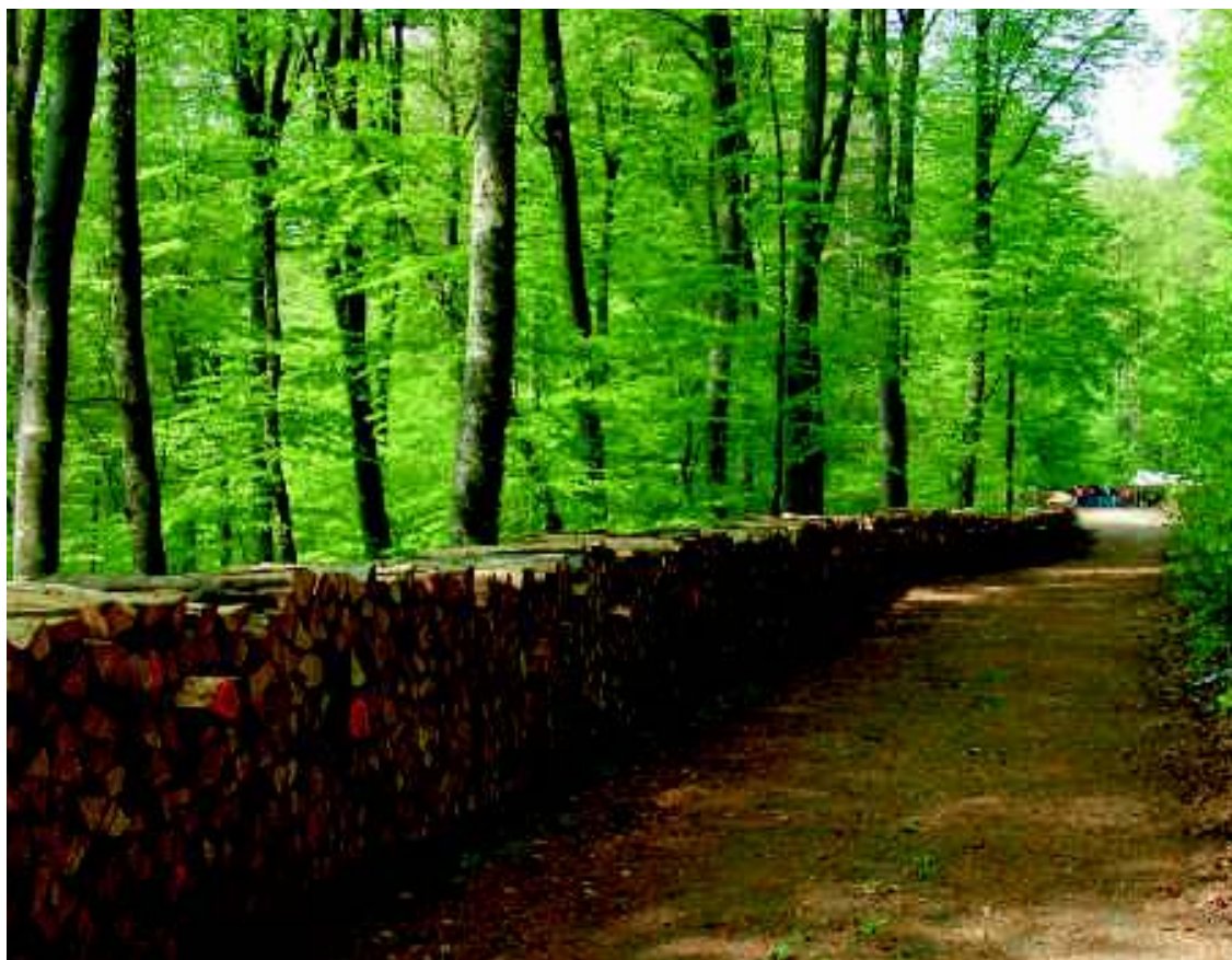
Samschdeg, den 25. Abrëll 2009 ass déi traditionell Holzstee mat Liëtsch zu Beefort an der Halerbaach ofgehal ginn.