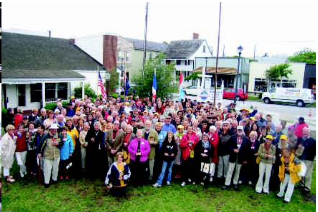
Auf Wiedersehen bis 2010 in Beaufort Haute-Garonne bei Toulouse in Südfrankreich