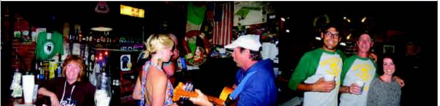
Backstreet Pub: the place to be...