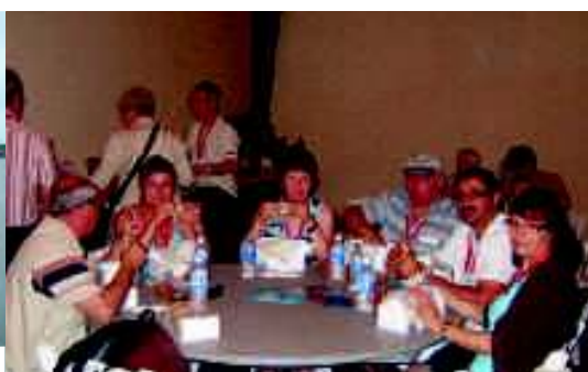
„Lunch“ im NC Aquarium