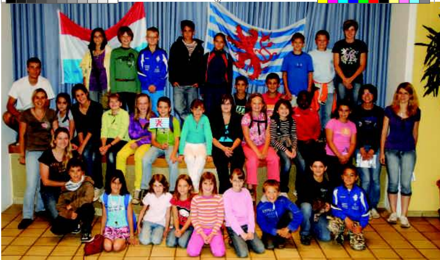
Déi 2. Woch woren et d'Kanner vum 3. bis 6. Schouljoer, am Ganzen 29 Kanner.

Während deenen 2 Wochen hu mir eng Schnitzeljuecht an ee Rallye gemaach. Vill vun eisen Atelieren stungen och ënnert dem Thema Lëtzebuerg: lëtzebuergesch Gebäck, lëtzebuergesch Musék a Gesank, Jéiner-Sprooch, een T-Shirt mam roude Léiw molen, d'Geschicht vu Beefort nom 2. Weltkrich, ee geographeschen Atelier mat interessanten Informatiounen iwwert eise Grand-Duché, asw.