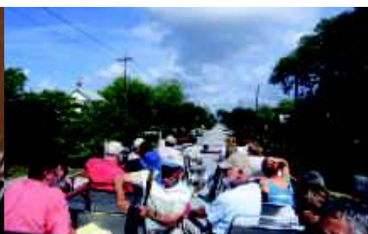
„Sightseeing“ mit dem Doppeldeckerbus