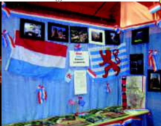
Traditionelle Ausstellung: „Lëtzebuerger Stand“ im Maritime Museum