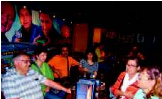
Airport Charlotte: erster Drink in den USA