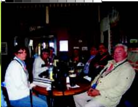
Apéro und Mittagessen im Clawson's Restaurant