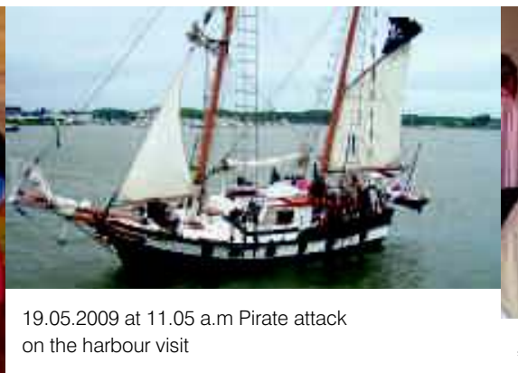
19.05.2009 at 11.05 a.m Pirate attack on the harbour visit