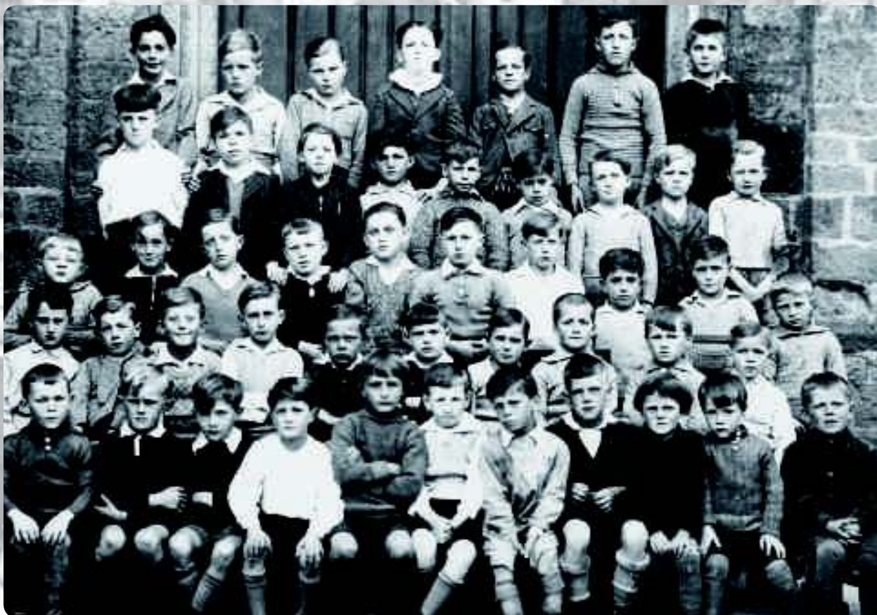
Schouklass zu Beefort aus dem Joer 1937/1938