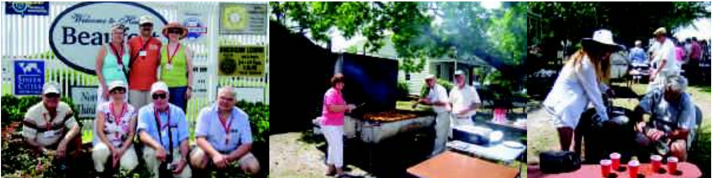
22.05.09 „Planting Flowers“ mit dem „Beaufort Garden Club“ am Town Gate „Goodbye Barbecue“ mit „Sausages“ und einer „Historical Beerpump“