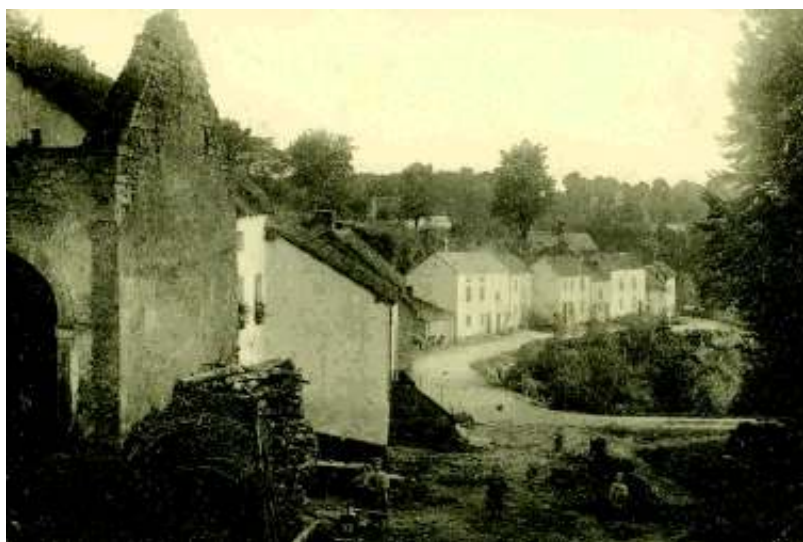
In der „Heck“ um 1900

(Auszüge aus Zeitungsberichten des „Luxemburger Wort“)