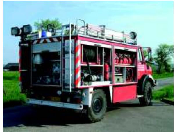
... dient den Beförtern als Tanklöschfahrzeug