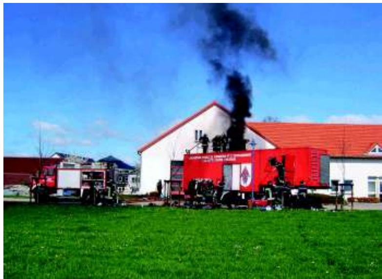
Nein, der Bau brennt nicht! Es ist eine Übung...