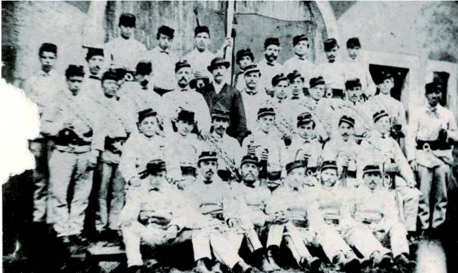
Das erste Foto der Beforter Feuerwehr