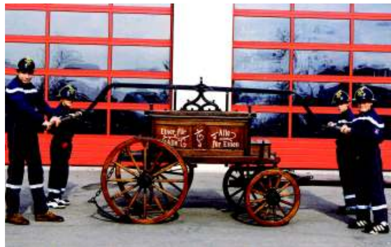
Wie die Zeiten sich ändern: die alte Handpumpe (oben) wurde in mühsamer Arbeit liebevoll restauriert. Heute verfügen die Beforter über modernstes Material.

Seit dem Bestehen des Beforter Feuerwehrcorps mussten die „Kadette vun der Sprët“ bereits zweimal umziehen. 100 Jahre lang war der Korps mitsamt dem technischen Material im alten Spritzenhaus im Dorfkern untergebracht. Anlässlich der Hundertjahrfeierlichkeiten 1981 wurde dort eigens das alte Wappen der Beforter Feuerwehr angebracht: es zeigt einen Löwen im Zentrum, einen Feuerwehrhelm sowie gekreuzte Beile. Darunter sind schlicht die Daten 1881 – 1981 eingetragen.