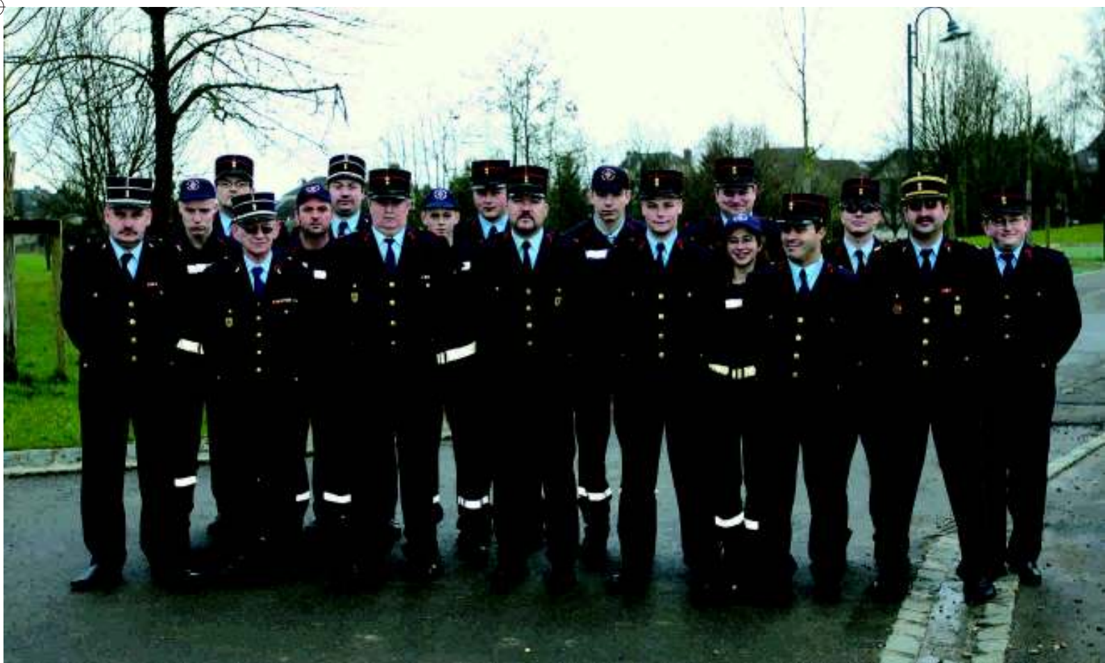
Die Beforter Feuerwehr im Jahre 2006