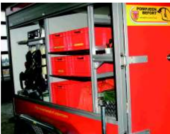
...aber auch um ihre beiden Mehrzweckanhänger (siehe auch den Schlauchwagen rechts) zu transportieren