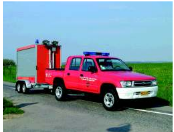
Der Pick-up wird als Kommandowagen genutzt...