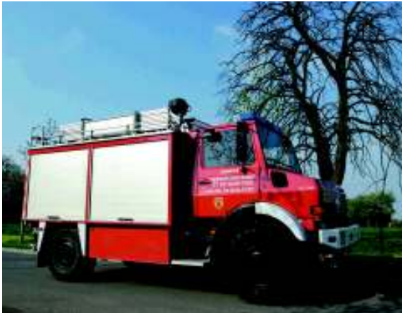
Ein Unimog aus dem Jahr 1995 namens "TLF 2000"...