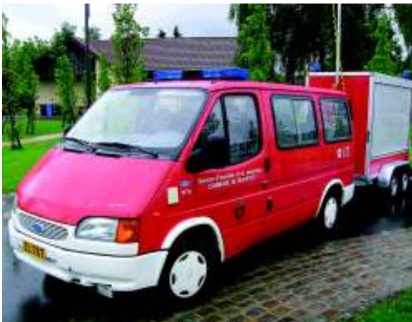
Mit diesem Ford-Bus aus dem Jahr 1996 werden die Personentransporte gesichert. Im Fachjargon nennt sich ein solcher Bus MTW (Mannschaftstransportwagen)