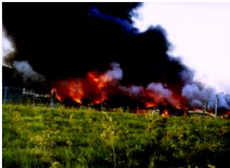
2. Oktober 1972: Die Firma Monsanto in Flammen...