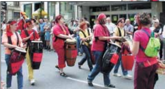
TOCA LA GUAGUA Cubanësch Carnavalsrythmen duerchsät mat engem gudde Schotz lëtzebuergeschem Feier