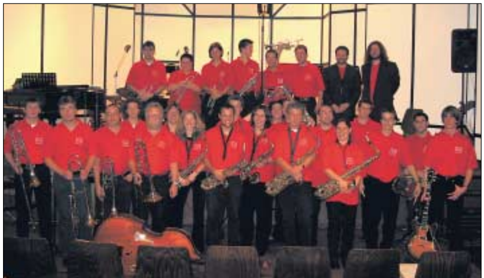
BIG BAND Ecole de Musique Echternach in Concert